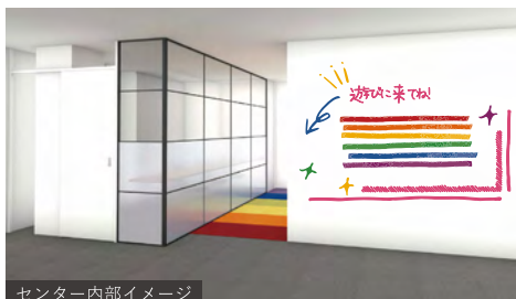
センター内部イメージ

センターには、イベントや相談ができる スペースと、LGBTに関する資料を集めた ミニ図書館を設置予定。