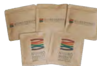
▲ドリップコーヒーパック