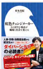
↑単著「虹色チェンジメーカー～LGBTQ視点が職場と社会を変える～(小学館新書)」

単著「虹色チェンジメーカー～LGBTQ視点が職場と社会を変える～(小学館新書)」／中小企業経営者向けLGBT基礎知識動画を無償公開(ファイザー助成)／LinkedInラーニング「LGBTも働きやすい職場環境を作るには」公開／京都市冊子「Diversity LGBTの視点から考える これからの職場づくり」、淀川区LGBT支援事業 保護者向けリーフレット「LGBTQってなんやろ?」制作／「近畿圏LGBT施策推進プロジェクト」実施(積水ハウスマッチングプログラム助成)／「Trans Lives Matter宣言」発表／埼玉県経営者協会、港区立商工会館、東京中小企業家同好会、太平洋人材交流センター、上本町SDGs大学等に登壇／日本銀行等で研修／東京都特別区職員、市町村職員向け研修／関西学院大、同志社大、明治大、京都外国語大、千葉県消防学校等で授業／異文化間教育学会、高等教育コンソーシアムみえに登壇／LGBTに関する相談先、支援先、報告先をまとめてホームページに掲載