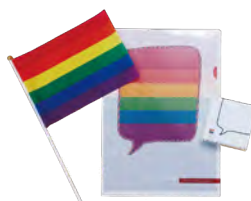
▲卓上レインボーセット