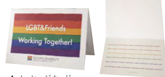
▲メッセージカード 仕上りサイズ:H105mm×W148mm セット内容:メッセージカード5枚、洋2封筒(白)5枚