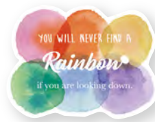
▲クラウドステッカー (H60mm × W80mm)