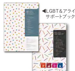
▲LGBT & アライ サポートブック