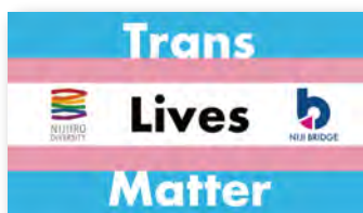
↑「Trans Lives Matter宣言」