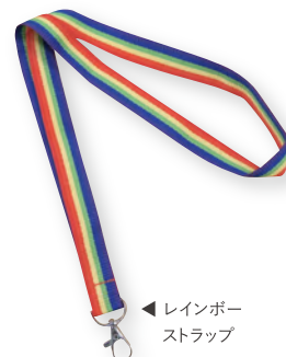
▲レインボー ストラップ