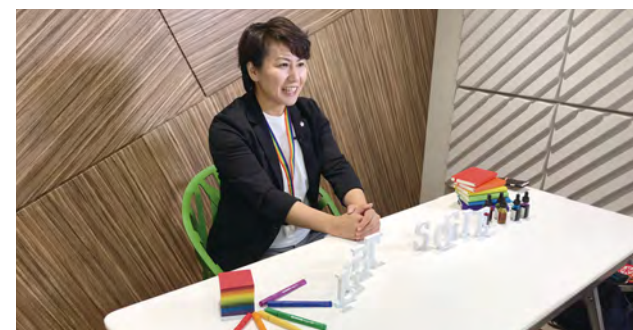
動画コンテンツ撮影風景

人事部門や本社だけでなく、現場や地方拠点にもLGBTの基礎知識を広めたい、というニーズにお応えして、動画教材(15分～20分)やeラーニング教材(スライド10～20枚)を制作、販売しています。ホームページで通信販売している冊子(500円)もとても好評です。