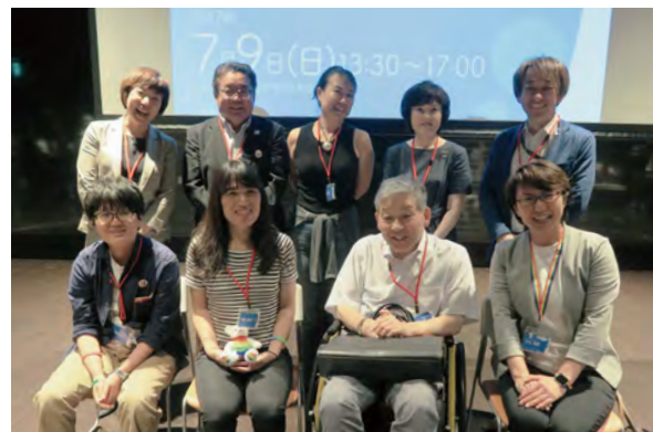
「性的マイノリティとトイレ・フォーラム」登壇者のみなさま