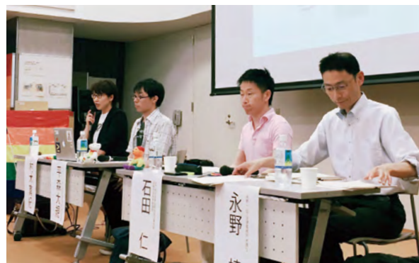
2016年の報告会の様子